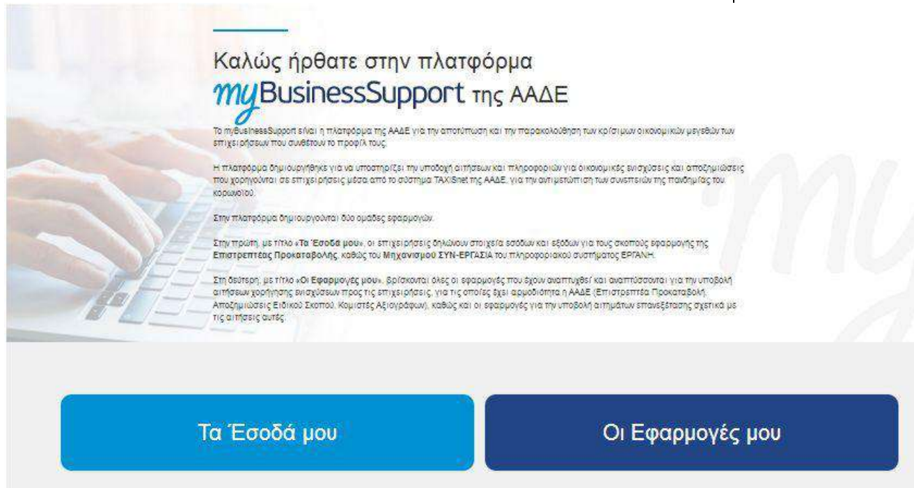
Εικόνα 1: Σελίδα της εφαρμογής στον διαδικτυακό τόπο της ΑΑΔΕ

Με την επιτυχή είσοδο στην εφαρμογή κατευθύνεστε στην επόμενη οθόνη και επιλέγετε «Επιστρεπτέα Προκαταβολή (5) Εκδήλωση Ενδιαφέροντος»