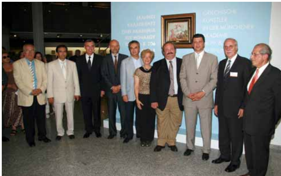
Από την έκθεση στο Τελλογόλιο Ίδρυμα.

να ξεφύγω απ' αυτό, γιατί η δουλειά του διπλωμάτη του δίνει τη δυνατότητα να ασχοληθεί επιπλέον με θέματα πολιτισμού, παιδείας, οικονομίας, άμυνας ή τύπου. Όμως για να γίνουν όλα αυτά χρειάζεται η σκέψη του νομικού και η νομική μεθοδολογία. Ναι, από αυτή την άποψη η νομική σκέψη, που μου έχει μείνει έτσι και αλλιώς, με βοηθάει πολύ.