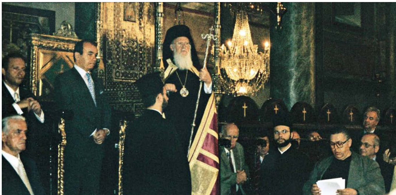
Η Αυτού Θειοπάτη Παναγιότης, Οικουμενικός Πατριάρχης κ.κ. Βαρθολομαίος κατά τη θεία λειτουργία προς τιμή των προστατών Αγίων της Συμβολαιογραφίας Αγίων Μαρκιανού και Μαρτυρίου.

Εμείς δεν θα γράψουμε για τον εορτασμό των προστατών μαρτύρων μας στην Κωνσταντινούπολη, αλλά θα τον περιγράψουμε μέσα από φωτογραφικό ρεπορτάζ.