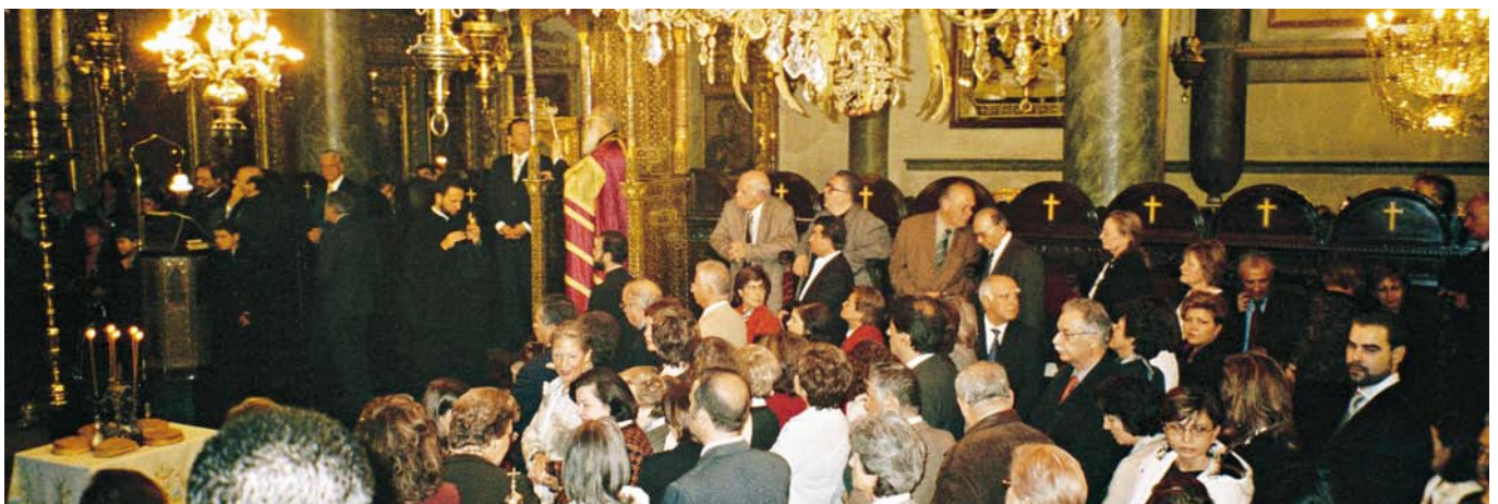
ΚΑΤΩ: Από τη θεία λειτουργία που τελέστηκε στον ιερό Ναό Αγίου Γεωργίου στο Φανάρι.