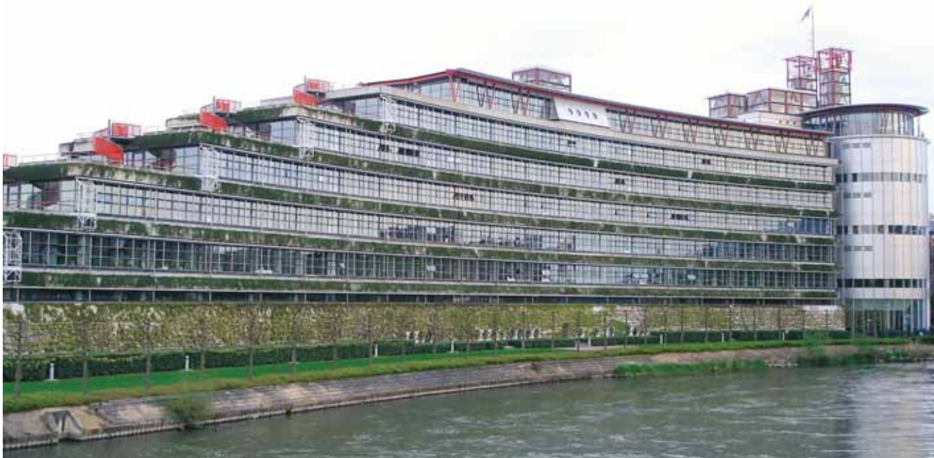
Το Δικαστήριο Ανθρωπίνων Δικαιωμάτων στο Στρασβούργο

Συμβολαιογράφος Αθηνών (Μέλος διαρκούς συμβουλίου της Ένωσης)