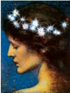
Η κόμη της Βερενίκης

..... μια καλοκαιρινή νύκτα, από αυτές, που μας περιμένουν, μακριά από τα φώτα της πόλης, ας τοημήσουμε ένα ταξίδι στον ουράνιο θόλο.