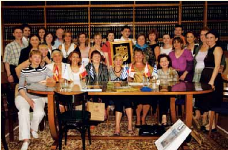
Στιγμιότυπο από τη συνάντηση στο Σύλλογο

Μια ομάδα ρώσων συνάδελφων ,από τα διάφορα σημεία της μεγάλης αυτής χώρας (μεγάλη ακόμα παρά την διάσπαση της τ. Σοβιετικής Ένωσης) μας επισκέφτηκαν στις 21 Μαΐου στο Σύλλογο. Συνάδελφοι από τη Μόσχα, την Αγία Πετρούπολη, το Νοβοσιμπίρσκ, το Γιάροσλαβ και αλλού, ήρθαν γεμάτοι κέφι και σφρίγος, γιατί ήταν και όλοι αθλητές, να γιορτάσουν τα δεκαπέντε χρόνια της ύπαρξης, καλύτερα επανασύστασης, της ρωσικής Συμβολαιογραφίας, στην Ελλάδα και μάλιστα στον Όλυμπο. Ο στόχος τους ήταν να βρεθούν πάνω στο βουνό των Θεών και να υψώσουν το έμβλημά τους, το οποίο μας το πρόσφεραν κι εμάς, μέσα σε μια ενθουσιώδη ατμόσφαιρα, με ανταλλαγές δώρων, ελληνικό κρασί και ρώσικη βότκα. Μας δόθηκε παράλληλα η ευκαιρία να συζητήσουμε και συμβολαιογραφικά ζητήματα και να δούμε τις διαφορές μας και τις ομοιότητες μας, που πάντα, όσο μακρινή κι αν είναι η χώρα, είναι περισσότερες.