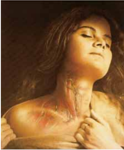
Πίνακας του Lauren Keswick