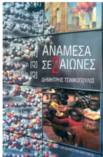
Το εξώφυλλο του τελευταίου βιβλίου του συγγραφέα, "Ανάμεσα σε δύο αιώνες"

Με την έκρηξη της πληροφορικής, παρουσιάστηκαν και τα εγκλήματα μέσω του διαδικτύου, όπως η παιδική πορνογραφία, η υποκίνηση τρομοκρατίας, η παρότρυνση σε